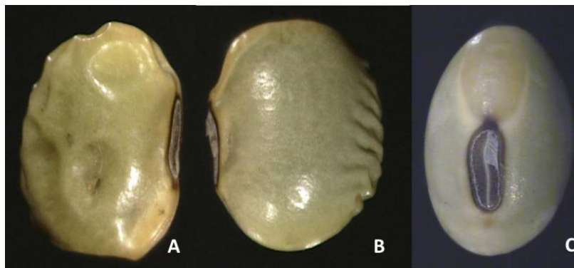
Figura 3. Semillas verdes con diferentes características físicas: A) abollada; B) arrugada y C) esférica

En función a estas características físicas (arrugas, abolladuras), que pueden presentar las semillas verdes de soja, es importante tener en cuenta que tanto las semillas esféricas como las semillas arrugadas, conformarán parte de la población de semillas destinada a la siembra. Para eliminar del lote las semillas verdes esféricas y arrugadas, se requiere del uso de tecnologías y/o equipamientos que puedan ser empleados en grandes volúmenes y que permitan la correcta identificación por coloración verde y su posterior separación de la masa de simientes.