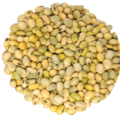
Figura 1. Muestra de soja con presencia de semillas verdes de diversas tonalidades